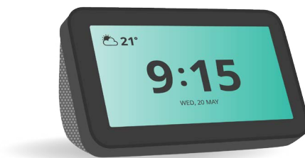
有些智能音箱還有顯示資訊用的彩色螢幕