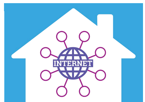
簡單的智能居家會用到 互聯網、Wi-Fi和一個智能音箱